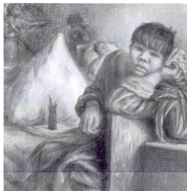
«Письмо родителям на Чукотку от давно брошенной ими дочери»

чало портиться, сильно обострился диабет. Всё труднее становится работать.