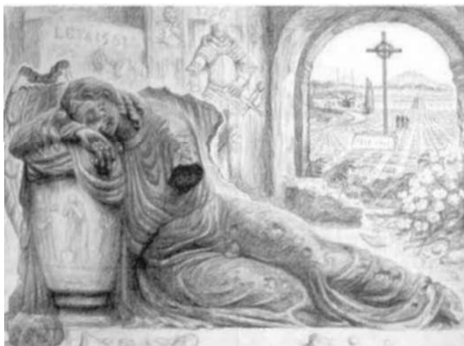
«Ангел-хранитель в концлагере Терезин»